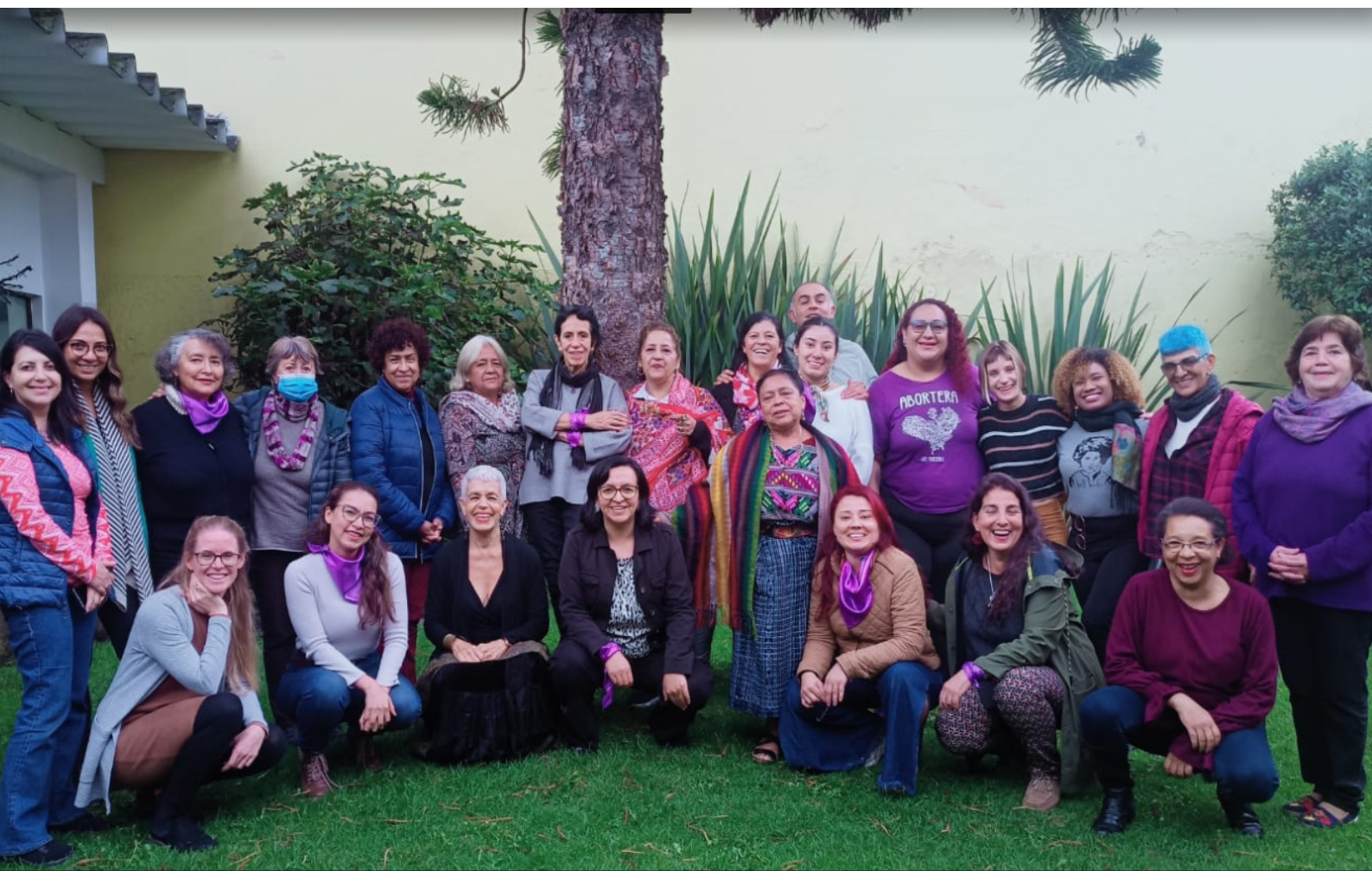
Encuentro de socias de la Red de Educación Popular entre Mujeres de Latinoamérica y el Caribe REPEM-LAC en Bogotá, Colombia. 1 de noviembre.

Educadoras Populares Tejedoras de Pensamiento ¡Por una educación pública, gratuita, laica, no sexista e incluyente para las mujeres y niñas de Latinoamérica y el Caribe!